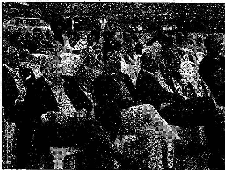
Sotto un consiglio comunale aperto nel cantiere di Nova Siri e a sinistra il senatore Latronico in prima fila

Latronico: "I pagamenti relativi alla variante di Nova Siri nelle prossime settimane"